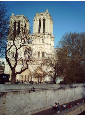
Kathedrale Notre Dame in Paris